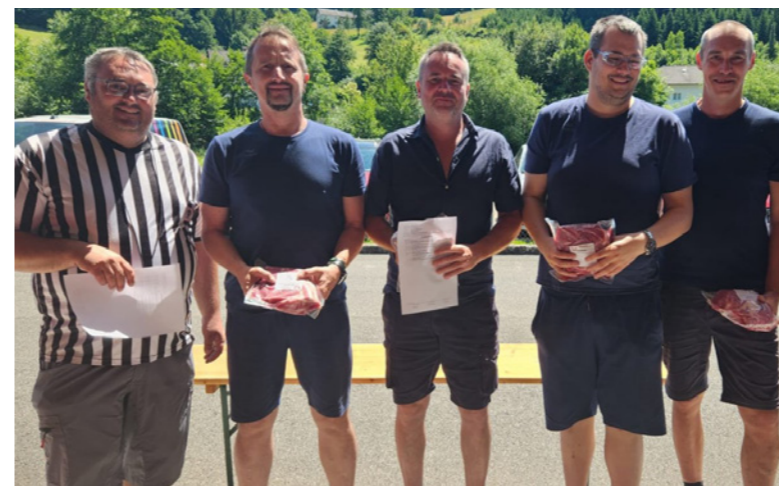
1. Rang Union Waldhausen

Am 17. Oktober veranstaltete auch unsere Sektion ein Turnier. Mit elf auswärtigen Mannschaften war die Norbert-Eder-Halle voll und wir machten auch als Veranstalter eine gute Figur. Als Sieger ging nach einer spannenden Schlussrunde die Mannschaft Union Rainbach hervor. Punktegleich belegte Union Schweinbach den zweiten Rang, gefolgt von TSU Wartberg/Aist. Herzlichen Dank allen Helfern, die beigetragen haben, dass unser Turnier als gelungene Veranstaltung bei den teilnehmenden Mannschaften in Erinnerung bleibt.