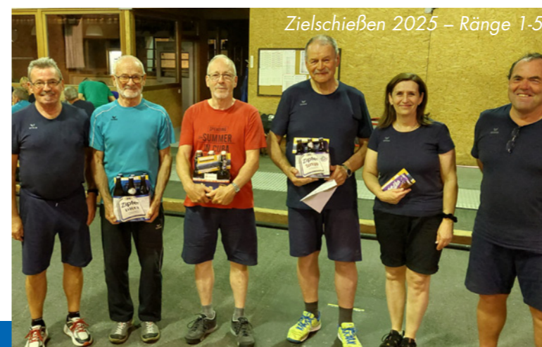
Zielschießen 2025 – Ränge 1-5

Für das Jahr 2026 wünsche ich viel Glück und Erfolg, vor allem aber Gesundheit.