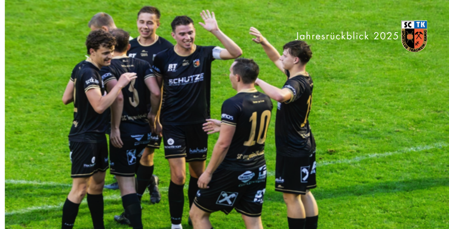
Jubel im Derby in der neuen Dress, gesponsert von SCHÜTZE Schuhe