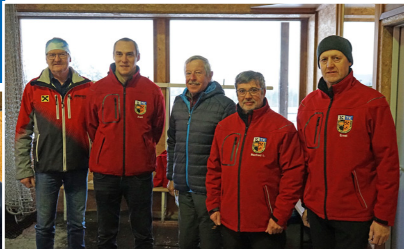
Ortsmeister 2025 - Vogeltenn