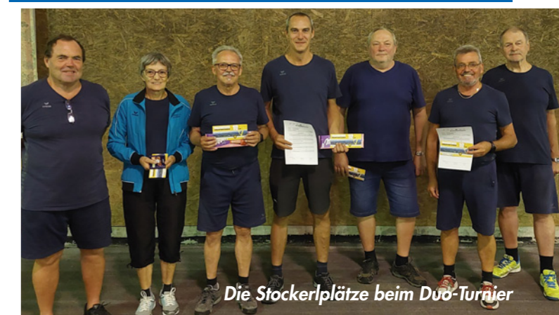
Die Stockerlplätze beim Duo-Turnier